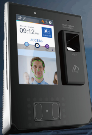
5インチタッチパネル液晶